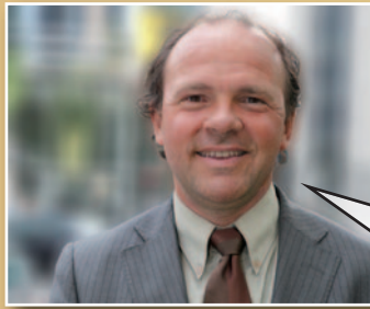
Philippe Muylers Vlaams minister van Financiën en Begroting

“Het Dexia-dossier hangt dit land als een molensteen om de hals. Als het verder fout gaat, stijgt de Belgische staatsschuld gigantisch. Ik vind dit gewoon hallucinant. De onbeantwoorde vragen stapelen zich ondertussen op. Maar Di Rupo zag geen beletsel om de Dexia-bestuurders kwijting te verlenen. Enkel het duidelijke ‘neen’ van de Vlaamse Regering deed de Belgische stem nog naar een ‘onthouding’ schuiven. Niet te begrijpen.”