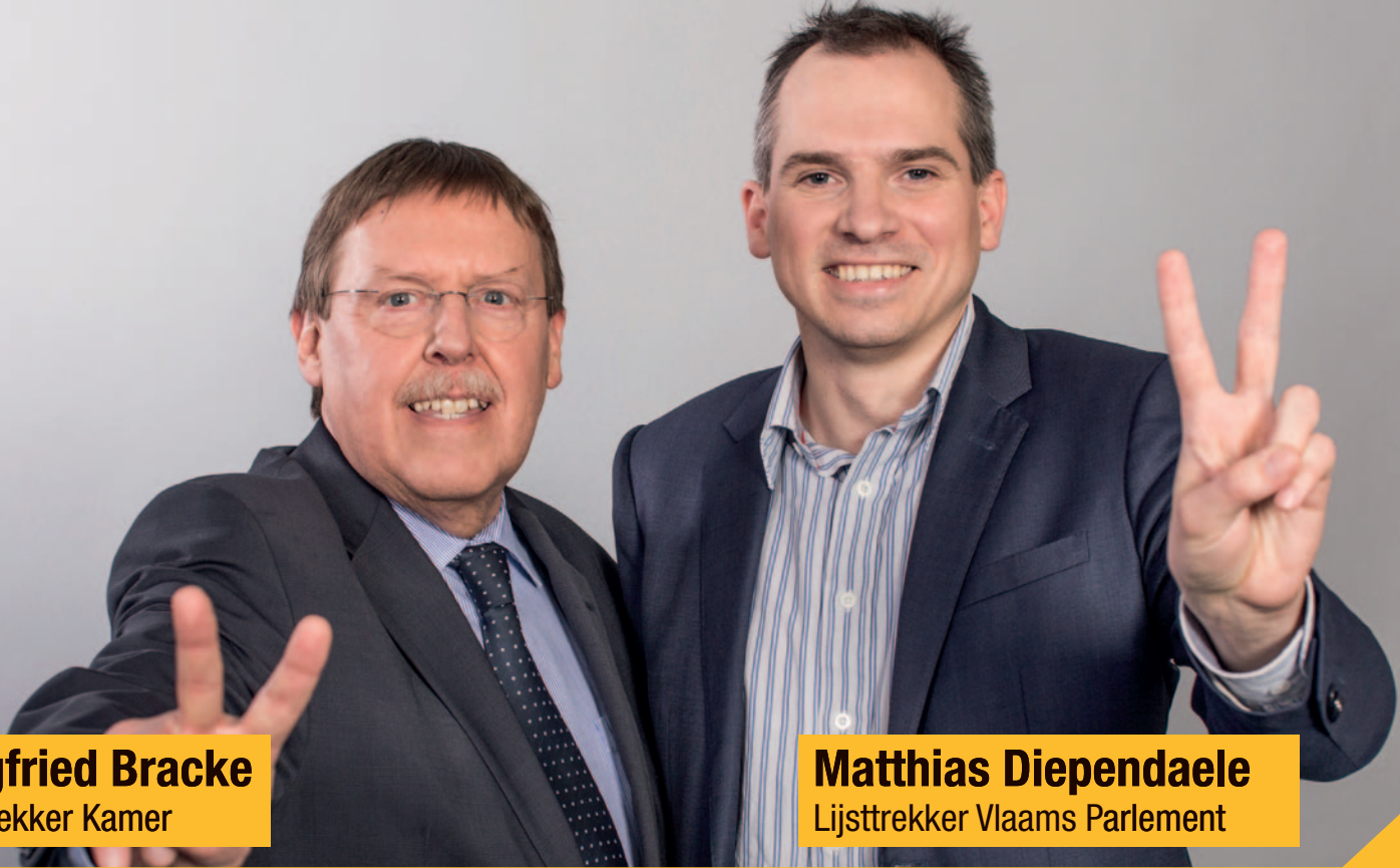
Siegfried Bracke Lijsttrekker Kamer