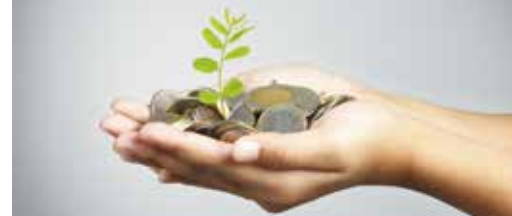
Erpe-Mere opnieuw financieel gezond p. 3